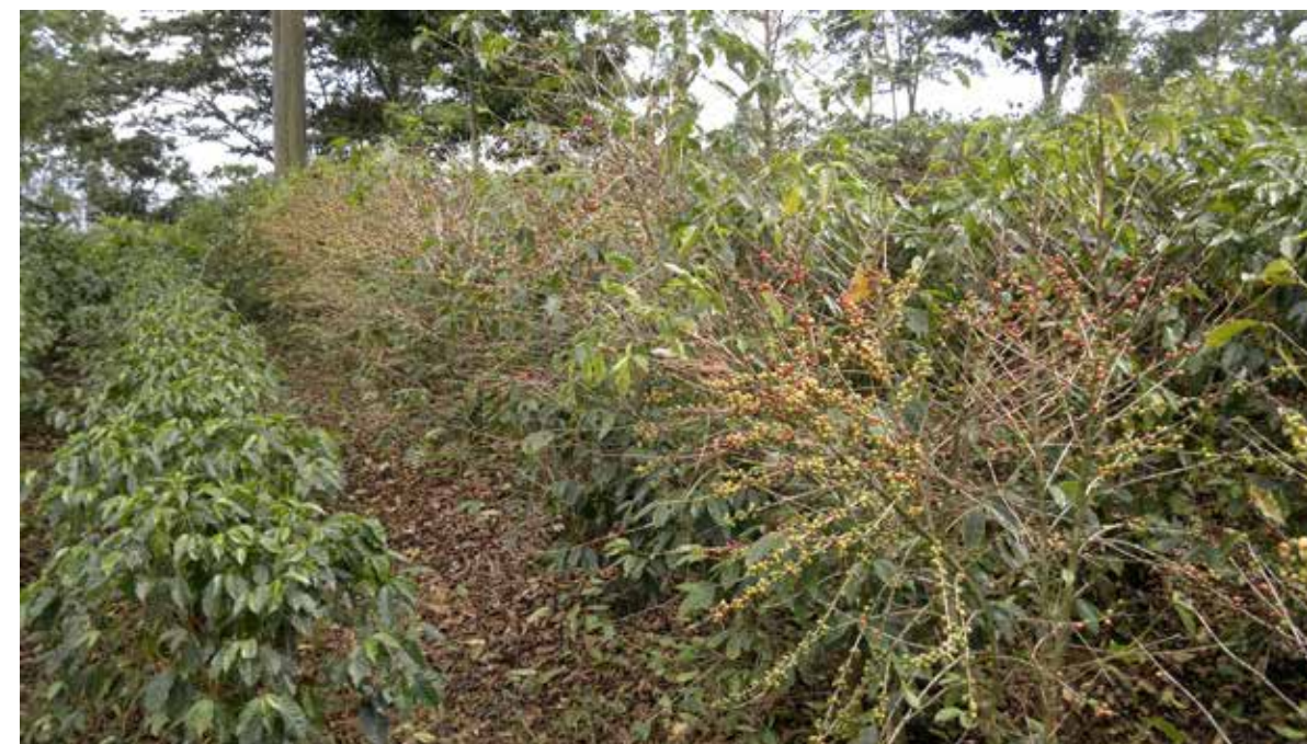
Cafetal afectado por la Roya, localizado en la Región Central Occidental.

A finales del mes de enero del 2013, el Gobierno de la República decretó dicha Emergencia, con el fin de agilizar la utilización de recursos económicos para apoyar a los cafetaleros.