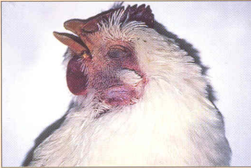
Congestión y edema

Las lesiones más frecuentemente descritas son: congestión pulmonar, edemas, cresta y barbilla amarillentas, cara inflamada, especialmente alrededor de los ojos y en las mucosidades de los orificios nasales y la boca y hemorragias. El resto de órganos y tejidos tienen una apariencia normal.