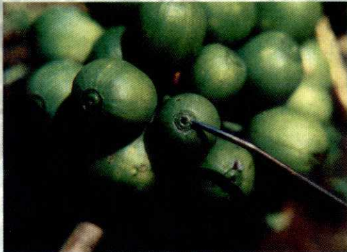
LA BROCA ENTRA AL GRANO POR EL OMBLIGO