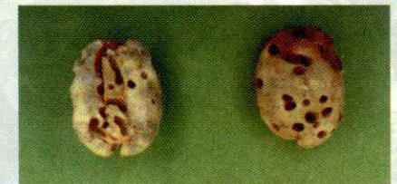
GRANOS CON ATAQUE AVANZADO DE LA BROCA DEL CAFÉ