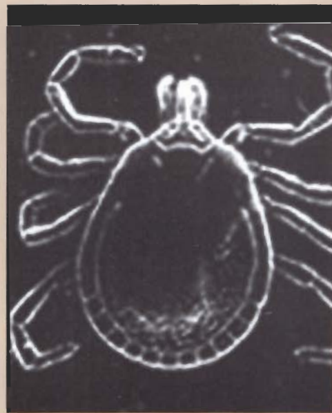
Agente transmisor: garrapata

Para mayor información consulte a su médico veterinario