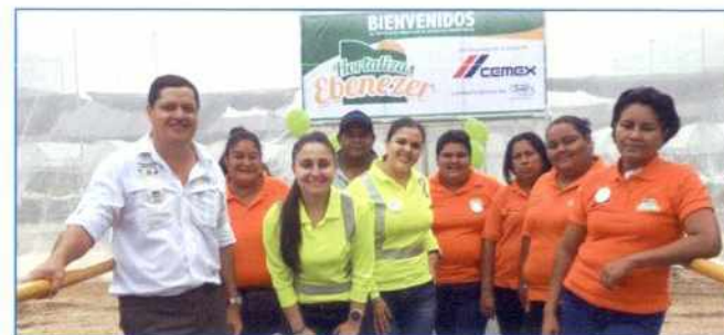
Figura 2. El INTA y CEMEX apoyan el grupo de mujeres "Hortalizas Ebenezer" en Colorado de Abangares