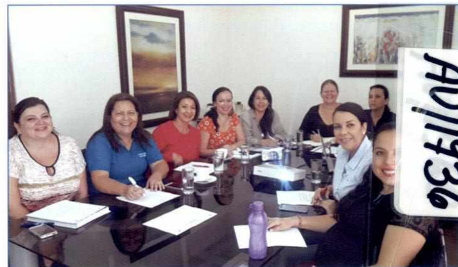
Figura 1. Sesión de trabajo de la Red Sectorial de Género y Juventud Rural.