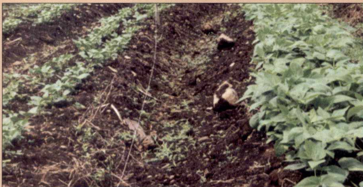
Efecto de un biofertilizante

E n la Lima de Cartago, las investigaciones realizadas en vainica utilizando Fertibiol , con una aplicación sólida adherida a la semilla y dos líquidas dirigidas al suelo, mostraron un mayor rendimiento que con la fertilización química; además el cultivo tratado no presentó problemas con enfermedades, mientras que Fusarium, Rhizoctonia y Mustia aparecieron en el tratamiento químico.