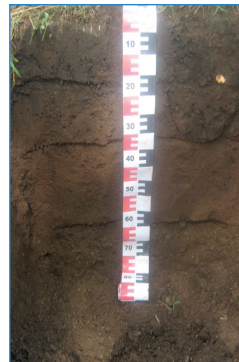
Figura 1. Perfil de suelo del orden Molisol, Estación Experimental Enrique Jiménez Núñez, Cañas, Costa Rica. 2013.