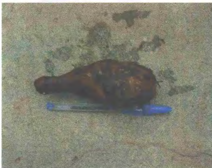
FIGURA 7: Cormelo pequeño (segunda)