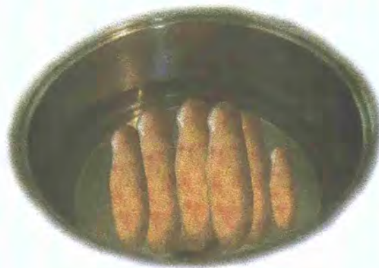
FIGURA 4: Tiquisque sancochado