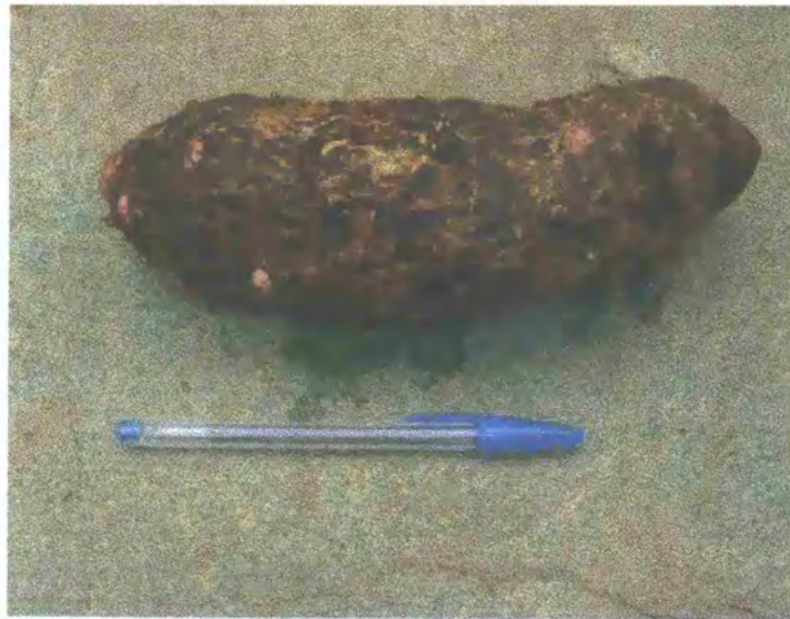
FIGURA 14: Cormelo recién cosechado y listo para empaque