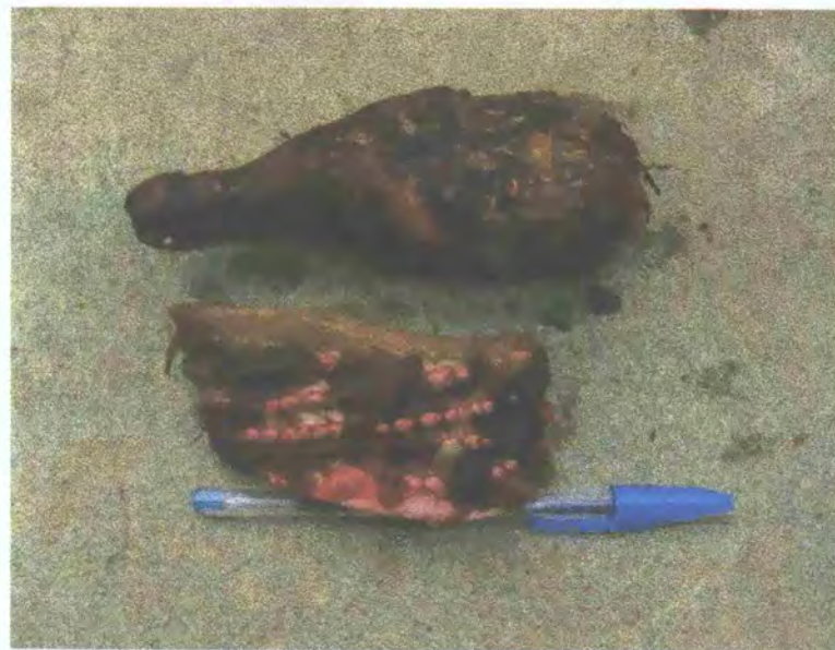
FIGURA 6: Trozo de corno y cormelo pequeño a utilizar como material reproductivo