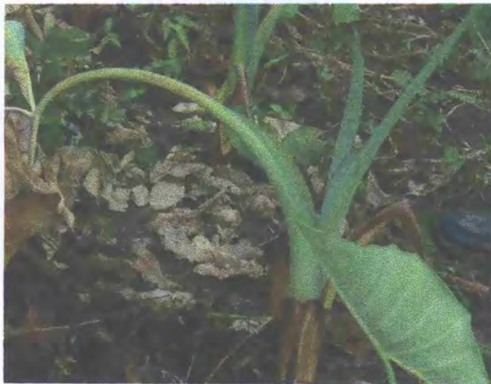
FIGURA 9: Planta con síntomas de la enfermedad "mal seco"