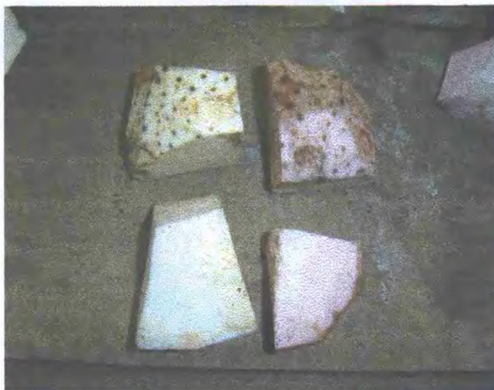
FIGURA 16: Trozos de corno central blanco y morado