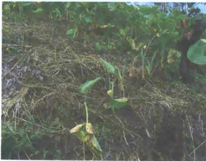
FIGURA 8: Plantación afectada con la enfermedad del "mal seco"

Cuando las condiciones son propicias las plantas de tiquisque son atacadas por varios patógenos, hongos y bacterias "Fusarium sp., Phytium sp., Erwinia caratovora, Rhizoctonia solani, Sclerotium sp.", causantes del mal seco (figuras 8,9,10,11), cuyo efecto final es la muerte de la planta.