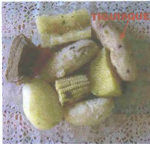
FIGURA 3: Tiquisque preparado en olla de carne