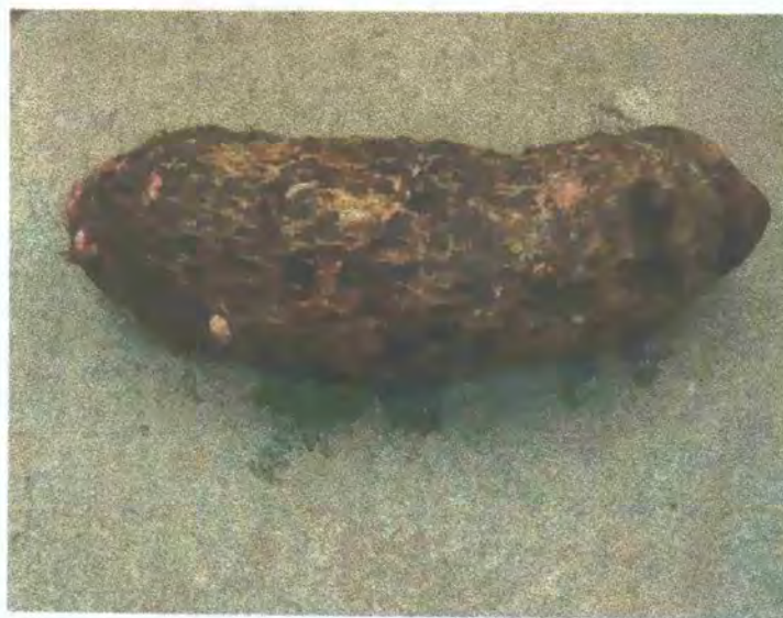
FIGURA 13: Cormelo recién cosechado y listo para empaque

La cosecha debe hacerse con mucho cuidado para evitar heridas o quebraduras a los cormelos, factores que hacen perder la calidad y provocan que o no sea recibido en el mercado.