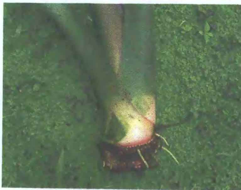
FIGURA 2: Corona del tiquisque