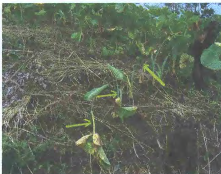
FIGURA 11: Plantas con sintomatología de la enfermedad "mal seco"