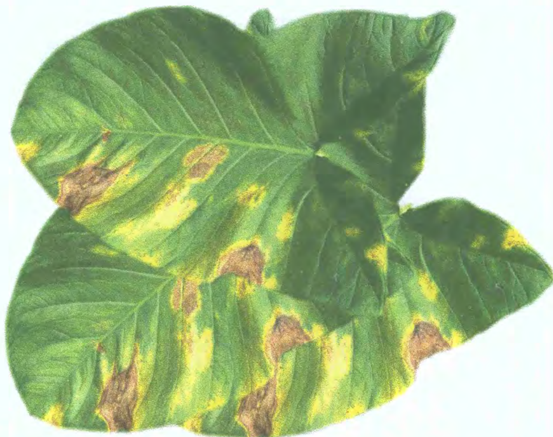
FIGURA 12: Sintomatología de bacteriosis