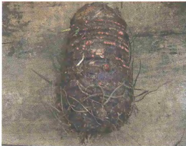
FIGURA 1: Cormo central de tiquisque

El tiquisque es considerado como una hierba perenne compuesta por un