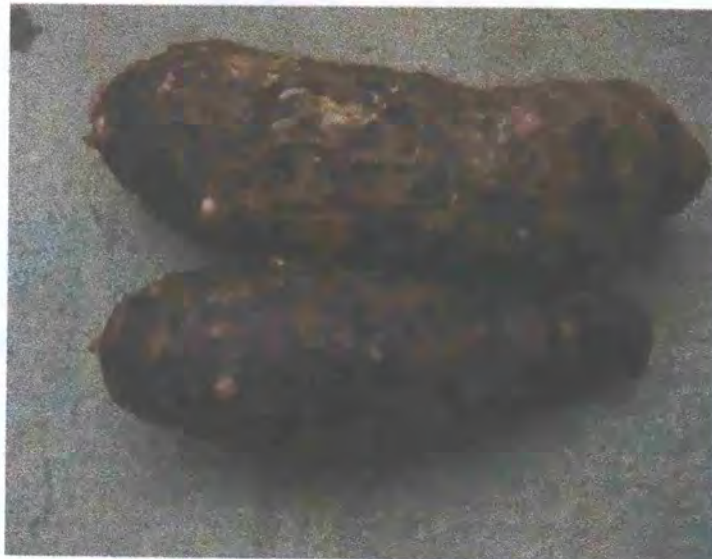
FIGURA 15: Cormelos recién cosechado y listos para empaque

El producto debe trasladarse bien acomodado en cajas o bandejas de plástico para así evitar pérdidas post-cosecha tanto en la manipulación del producto como en el transporte.