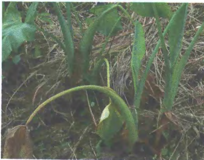
FIGURA 10: Planta atacada por la enfermedad "mal seco"