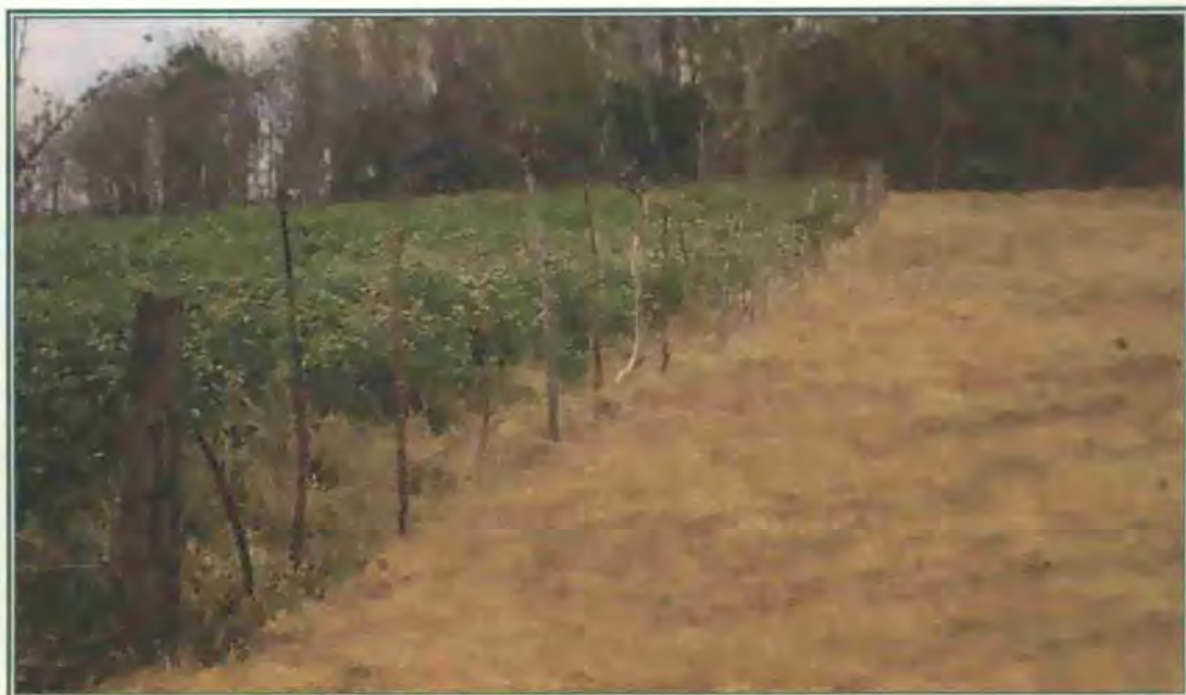
Al lado izquierdo rebrote de un banco forrajero de Cratylia argentea cv Veraniega durante la época seca en el Pacífico Central de Costa Rica.

Las plantas adultas de este cultivar toleran el fuego y pueden rebrotar de yemas presentes en la corona de la raíz. Una de las características más importantes es su capacidad de rebrote y retención de hojas durante la época seca, lo que está asociado con el desarrollo de raíces vigorosas que alcanzan hasta 2 m de longitud (E. A. Pizarro, comunicación personal). Los resultados en Costa Rica y otros lugares muestran que durante este período crítico la planta produce entre 30% y 40% del rendimiento total de forraje (Argel, 1995; Lobo y Acuña, 2001a; I. Rodríguez, comunicación personal).