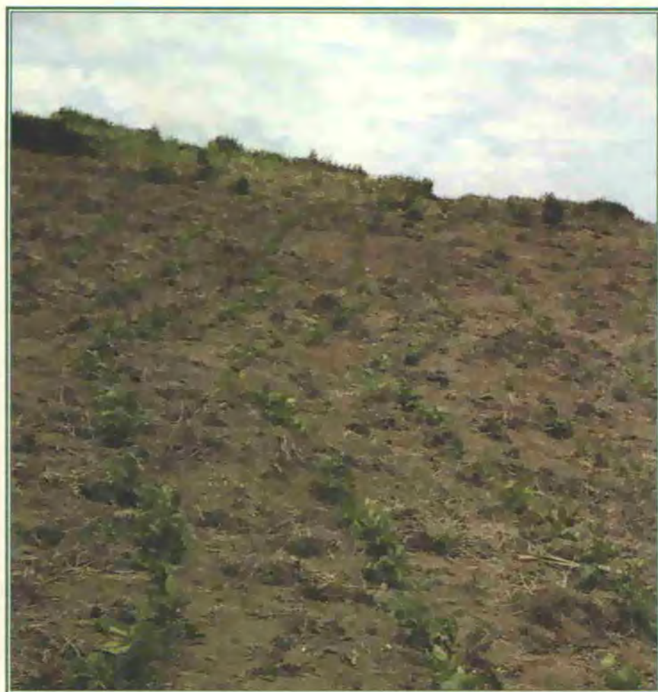
Establecimiento de Cratylia argentea cv. Veraniega por medio de siembra directa con semilla en un suelo preparado en forma convencional. Nótese la pendiente y el buen drenaje del terreno.

La formación de nódulos que contengan rizobios fijadores de nitrógeno es una característica deseable en las leguminosas. Para estimular esta condición se recomienda inocular las semillas de C. argentea con cepas de rizobio de tipo caupí, que son comunes en suelos tropicales. La experiencia muestra una buena respuesta de este cultivar en la formación efectiva de nódulos cuando se inocula con las cepas Bradirrhizobium CIAT 3561 y 3564, particularmente en suelos ácidos con alto contenido de aluminio (RIEPT-MCAC, 1996). Una res-