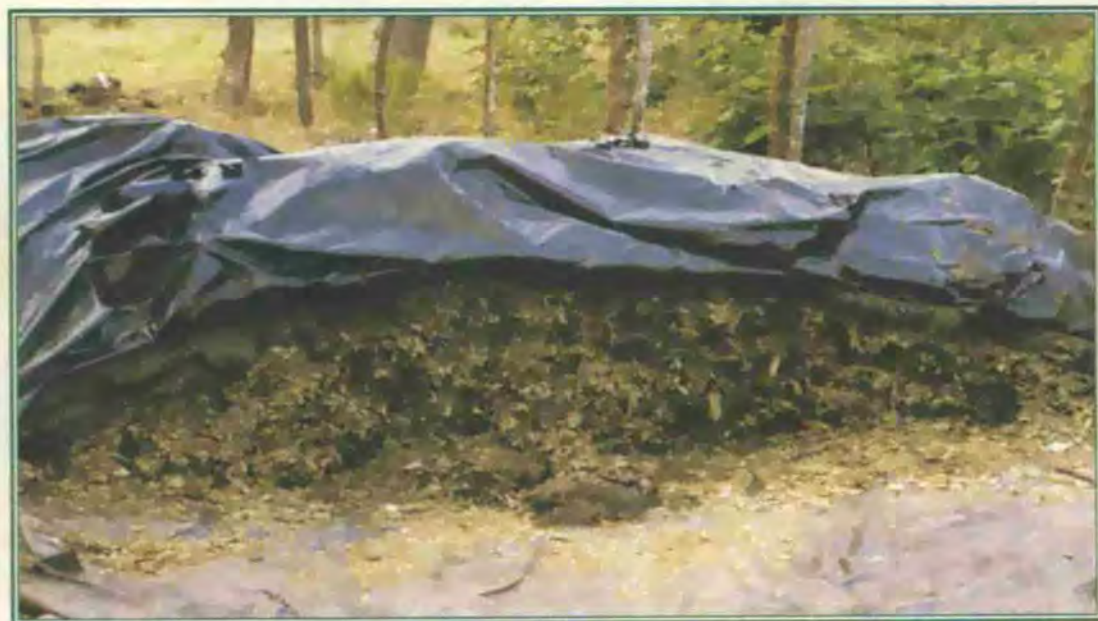
Aspecto de un silo de montón de Cratylia argentea cv. Veraniega, 5 meses después de fabricado agregando 10% de melaza con base en el peso fresco del material picado.

La elaboración de ensilaje de C. argentea cv. Veraniega fue una iniciativa de los productores de la región Pacífico Central en Costa Rica, quienes encontraron en este sistema la mejor forma de utilizar el forraje residual de los bancos no utilizado en la época de lluvias. El sistema consiste en cortar rebrotes de plantas con 90 a 120 días de edad, los cuales una vez picados en porciones de 2 a 5 cm, son apilados y compactados en silos de montón, donde se distribuyen en capas de 20 a 25 cm y se cubren con material plástico. Generalmente la elaboración del silo toma entre 3 y 4 días. Algunos productores han tenido éxito ensilando el material en bolsas y sacos de plástico (A. López, comunicación personal)