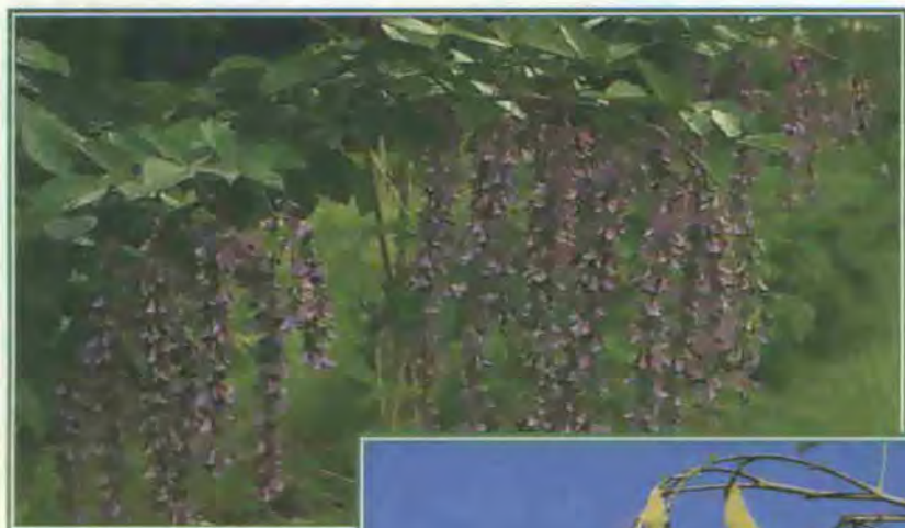
Inflorescencias (seudoracimos) y frutos (vainas) de Cratylia argentea cv. Veraniega

Por su baja latencia física (dureza) y fisiológica las semillas del cv Veraniega pierden viabilidad relativamente rápido, si son almacenadas en las condiciones ambientales de temperatura y humedad comunes en regiones de trópico bajo. Por ejemplo, en la ECAG, Atenas, Costa Rica, con una temperatura promedio de 24 °C y humedad relativa de 70%, se ha encontrado que la germinación disminuye de 80% a 50%, 24 meses después de la cosecha (CIAT, 1999)