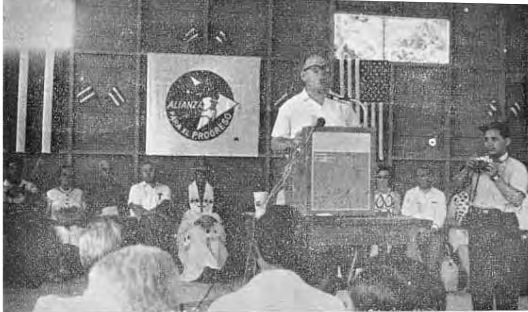
El Sr. Presidente de la República don Francisco J. Orlich, declara inaugurada la Estación Experimental Enrique Jiménez Núñez.