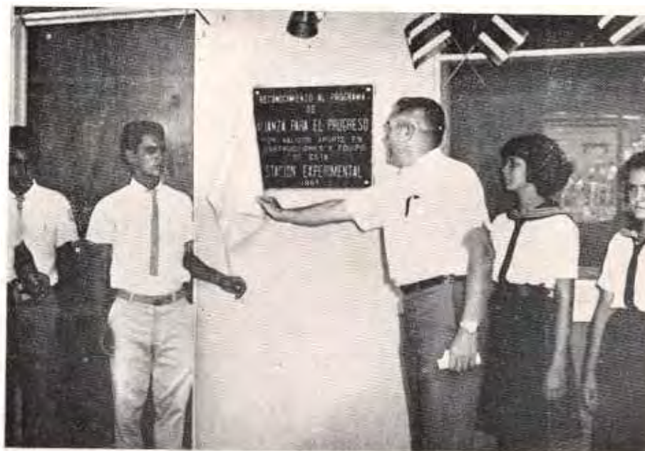
Placa Conmemorativa de reconocimiento a Alianza para el Progreso.