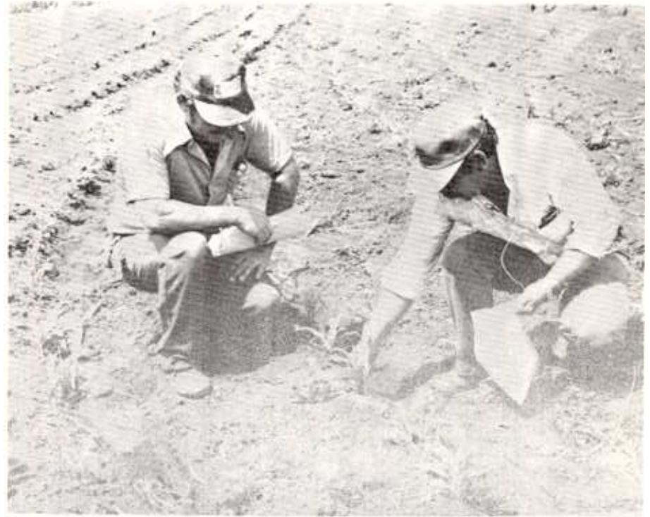
El extensionista muestra al "agricultor enlace", cómo se hace la segunda fertilización en maíz