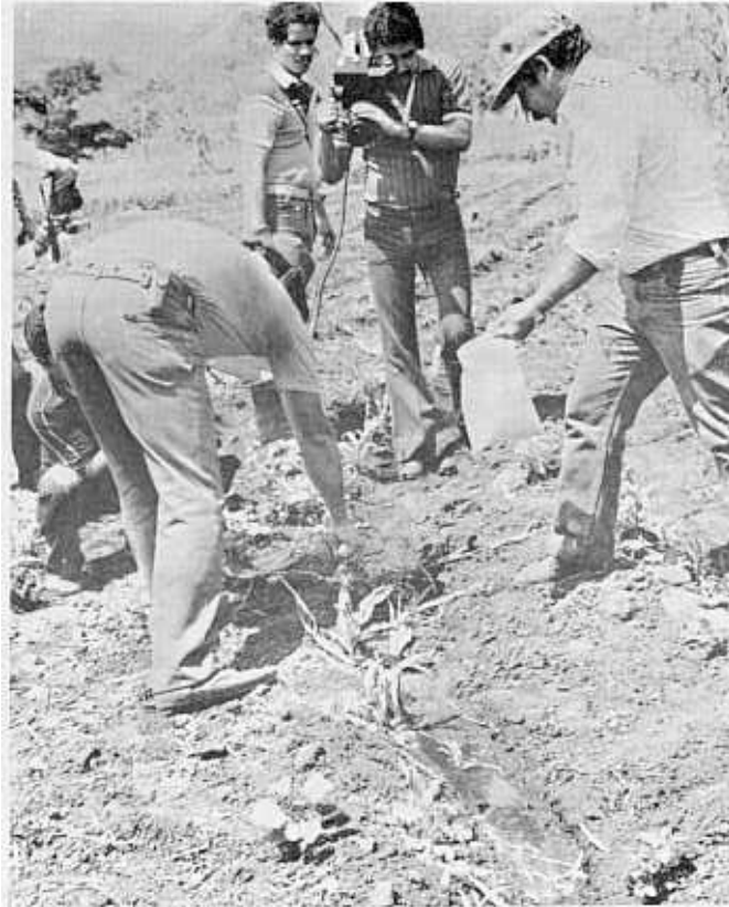
El “agricultor enlace” realiza la misma labor bajo la supervisión del extensionista