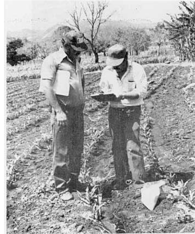
Realizada la demostración, el extensionista llena la hoja de registro con la información del “mensaje” de ese día