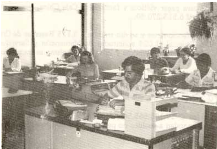
Vista parcial del Departamento Financiero

Con base en los ingresos reales y en los gastos efectivos entre todas las cuentas, quedó un superávit de \text{Q} 9.378.365.84.00 .