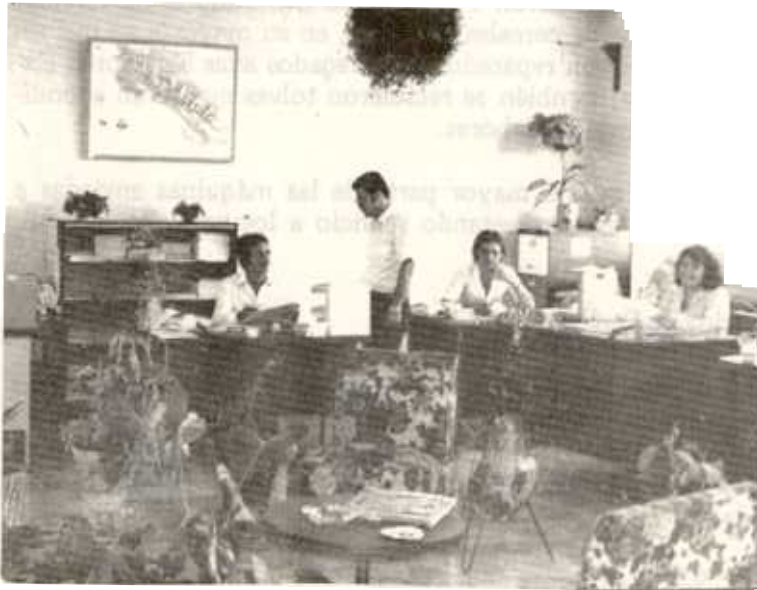
Vista parcial del Departamento de Servicios Administrativos

En las cuentas especiales de los diferentes programas el gasto de gasolina fue de 47.800.00 y el de diesel de 32.160.00, dando la suma por ambos de 79.960.00 litros.