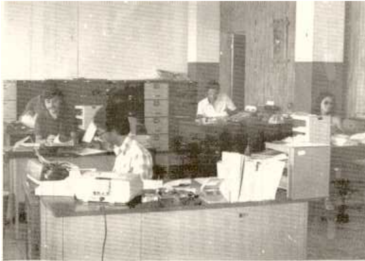
Oficina de Personal

Con el paso de los jornales al régimen Clasificado de Servicio Civil, el Departamento efectuó el estudio y clasificación de 425 puestos.