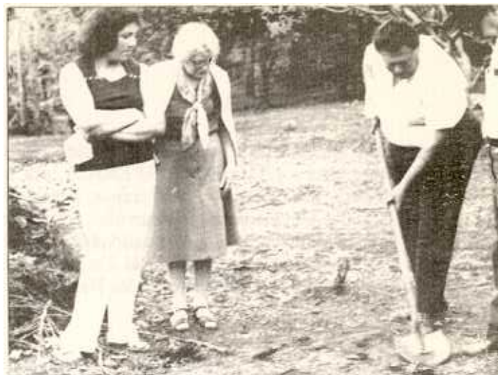
Dos señoras atienden la demostración