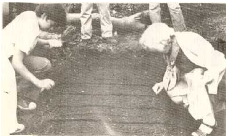
La acción de sembrar ejecutada por los que atendieron la demostración. Como ésta, fueron muchas las que se efectuaron