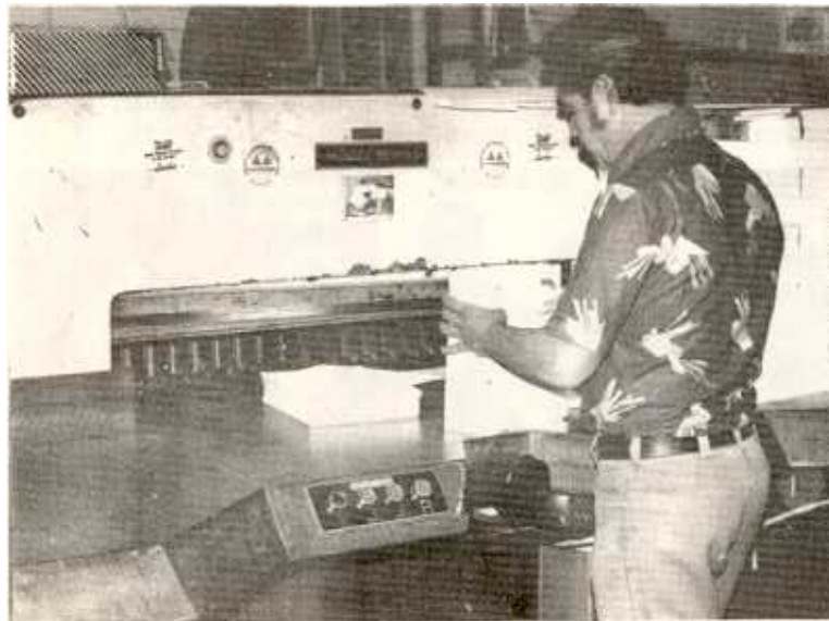
Preparación del material para la impresión.