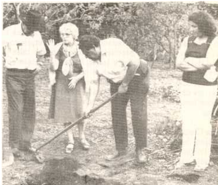
Demostrando cómo hacer una era para plantar