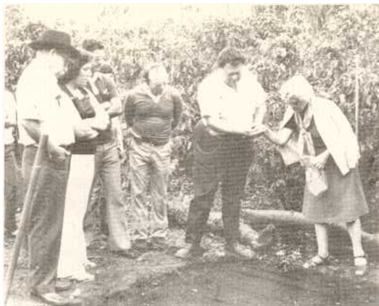
La interesada en el momento de participar en la demostración