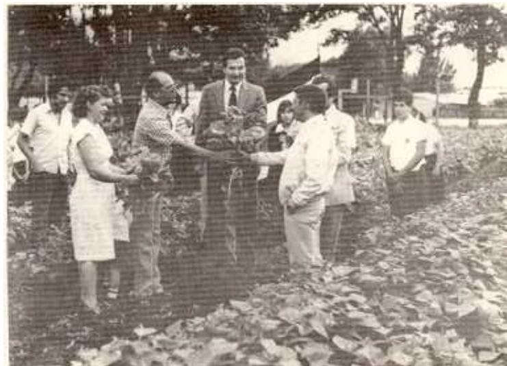
Inauguración de la huerta de Jardines de Tibás

Desde mayo hasta diciembre se realizaron huertas en el Liceo San José, Sabana Sur, Pavas, frente a Casa Presidencial, contiguo al Cementerio de Curridabat, Asilo de Ancianos de Desamparados, Jardines y Llorente de Tibás, Liceo José Joaquín Vargas Calvo, San Sebastián, Zapote, Desamparados centro y en la Primera, Segunda, Tercera y Quinta Comisarias de San José.