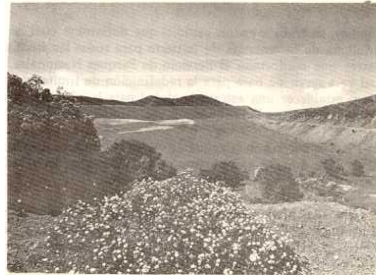
Parque Nacional Volcán IRAZU

Se logró elaborar una estrategia para dar prioridad a la adquisición de tierras en el parque mencionado en el párrafo anterior y se logró adquirir algunas propiedades vitales para el futuro desarrollo del área.