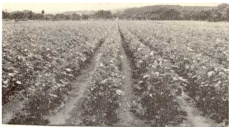
Lote de producción de semilla de algodón de la variedad DES 24, en la Finca La Cueva, Liberia.

La variedad DES-24 y DES-56 seleccionadas por el programa a través de pruebas comparativas, muestran excelente comportamiento en el Pacífico Seco, donde con apropiadas técnicas de manejo han obtenido rendimientos de 5,8 pacas/oro/hectárea. De ambas variedades se produjo semilla básica para suplir las necesidades de los algodoneiros a corto plazo.