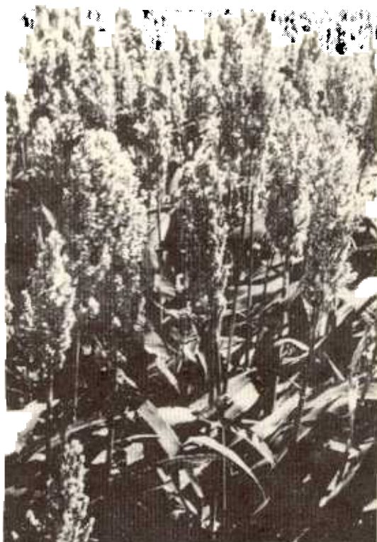
Evaluación agronómica de híbridos de sorgo para uso comercial, en la Estación Experimental Enrique Jiménez Núñez.

ciones de 200.000 a 300.000 plantas por hectárea, lo que representa una economía de semilla para los agricultores.