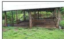
Establo con piso de cemento

Se debe construir un establo que los proteja del sol, lluvia y también para alimentarse. El piso de este establo puede construirse en materiales como madera o cemento para favorecer la recolección de excrementos y disminuir la alta incidencia de parásitos.