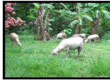
Animales en pastoreo

La actividad ovina es una opción a considerar por los productores (as) con deseos de introducirse en nuevos sistemas de producción. Para ello debe prepararse con pastos, bancos forrajeros, cercas, establos.