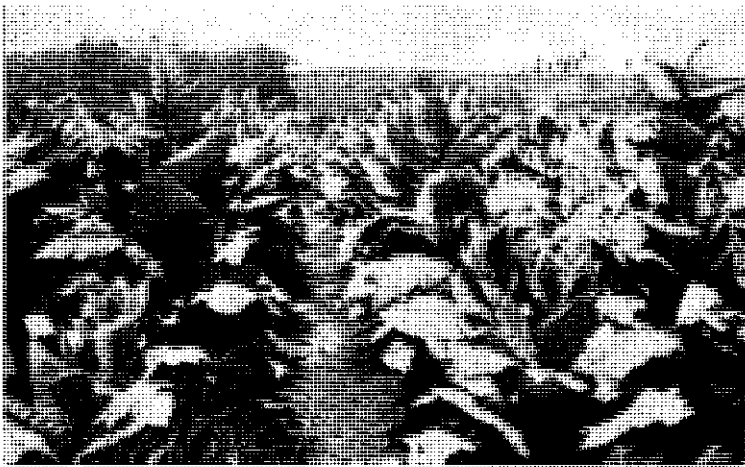
Fig. 4.— Terrenos planos en las nuevas zonas permiten la mecanización de muchas de las labores en el cultivo.

2. La fertilidad del suelo. En la mayoría de los casos, la aplicación de abono para el cultivo puede ser sólo una tercera parte del costo total del fertilizante usado en las zonas actuales. Es más, la gran fertilidad de los