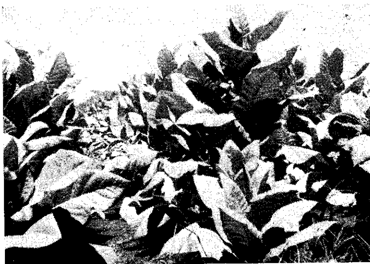
Fig. 5.— Vigoroso desarrollo de variedades de tabaco de estufa en las nuevas zonas.

Ahora bien, no obstante que ese desplazamiento del cultivo tendría que efectuarse en un futuro, existe una serie de problemas de carácter social y económico que son factores que se oponen a un rápido desplazamiento. Son muchos los agricultores de las zonas actuales que dependen del tabaco como fuente de utilidad mínima para su subsistencia. Pero si es posible asegurar que por lo menos el cultivo de tabaco estufado que puede llegar a representar un 10% del total producido en el país, muy pronto experimentará un amplio desarrollo en esas nuevas zonas de producción.