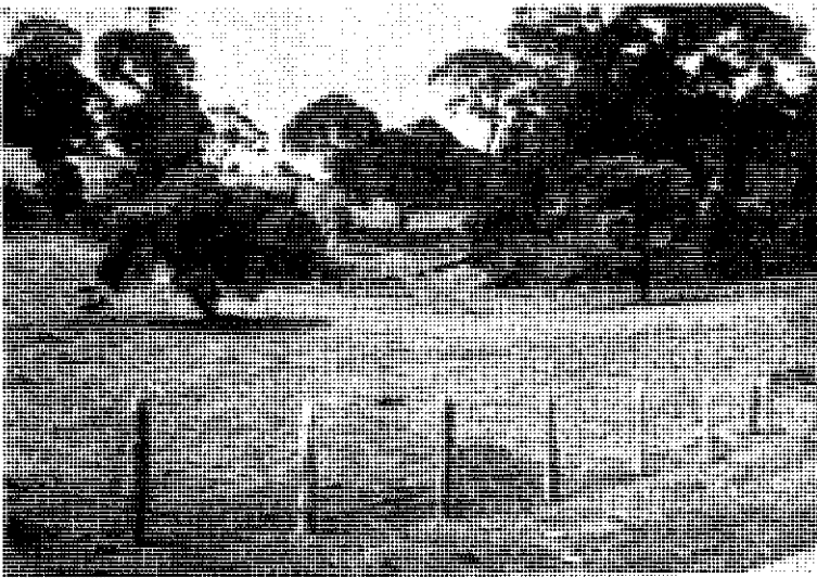
Fig. 3.— Pastos de kikuyo en la zona de bosque montano muy húmedo como en el Volcán Irazú, son excelentes para vacas de leche europeas.

Ejemplo: Finca El Volcán, Costa Rica, (Fig. 3); las áreas en Guatemala, Costa Rica y Panamá son muy limitadas. Son buenos para ganadería de leche únicamente aquellos suelos de poca pendiente y de formación volcánica reciente. Todos los demás deben permanecer como bosques.