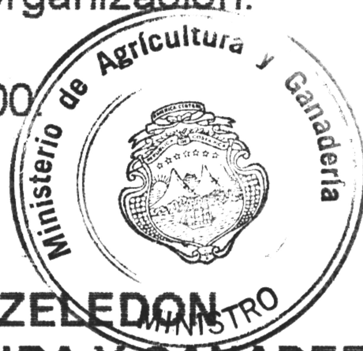
ALBERTO DENT ZELEDON MINISTRO DE AGRICULTURA Y GANADERIA