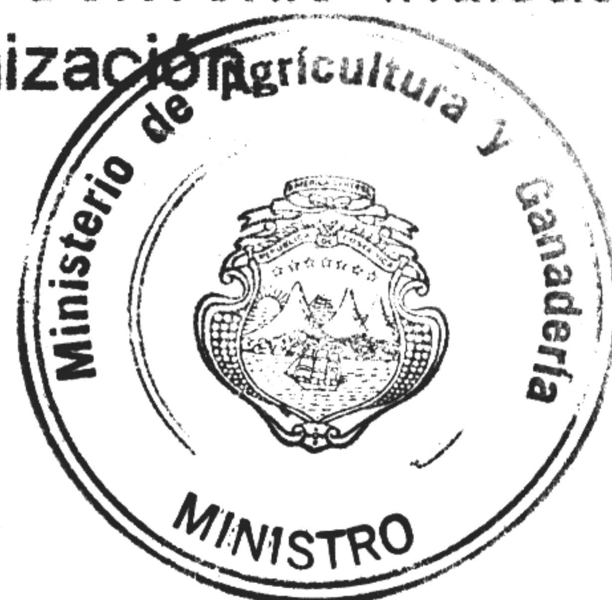
ALBERTO DENT ZELEDON MINISTRO DE AGRICULTURA Y GANADERIA