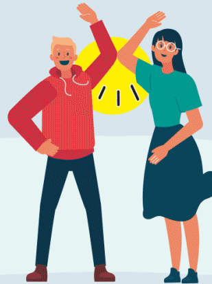
CON EL CODO