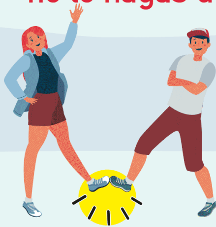
CON EL PIE