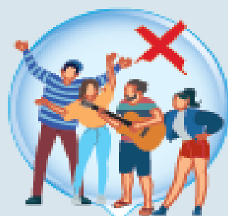
GRUPOS DE AMIGOS