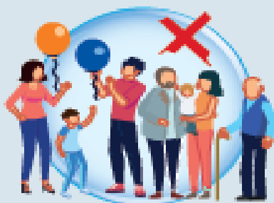
INTEGRANTES DE FAMILIAS QUE NO ESTÁN DÍA A DÍA CONVIVIENDO