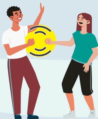
CON EL PUÑO DE LEJOS