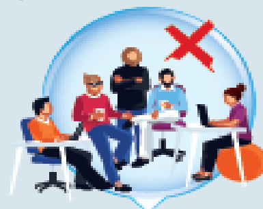
COMPAÑEROS DE TRABAJO