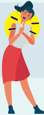
JUNTANDO LAS MANOS