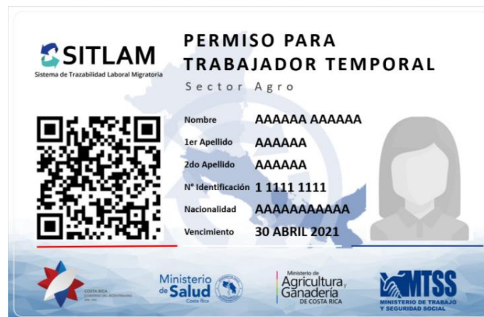
Ilustración 3.- Carné SITLAM