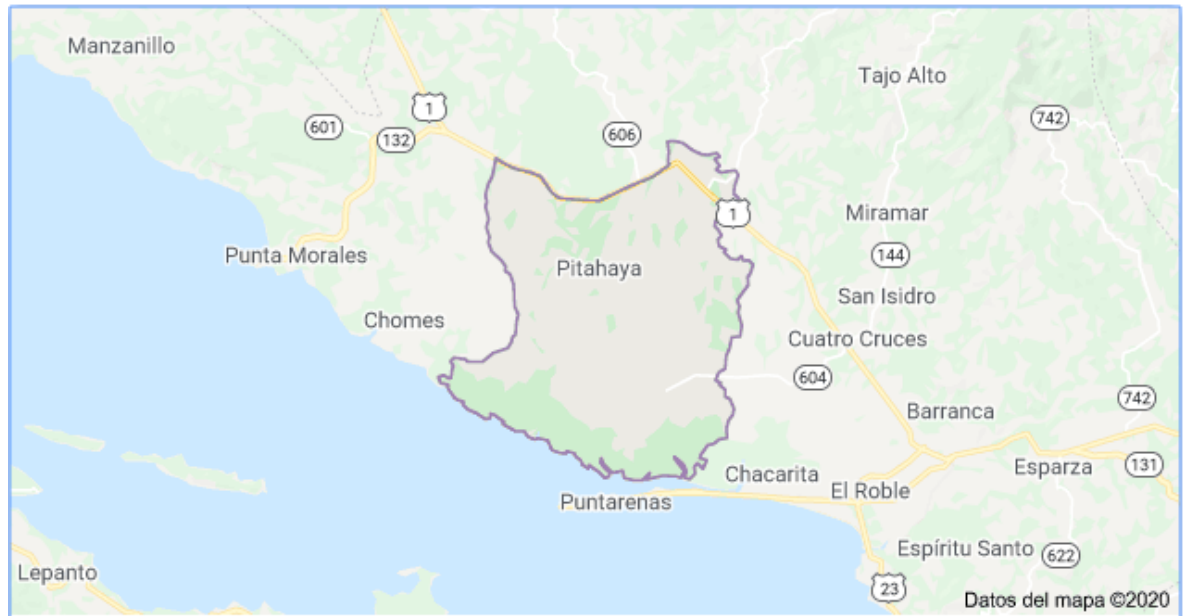
Figura 2. Distrito de pitahaya 35 % de su territorio corresponde a la AEA de Chomes el otro 70% a las agencias de Miramar y Cedral.