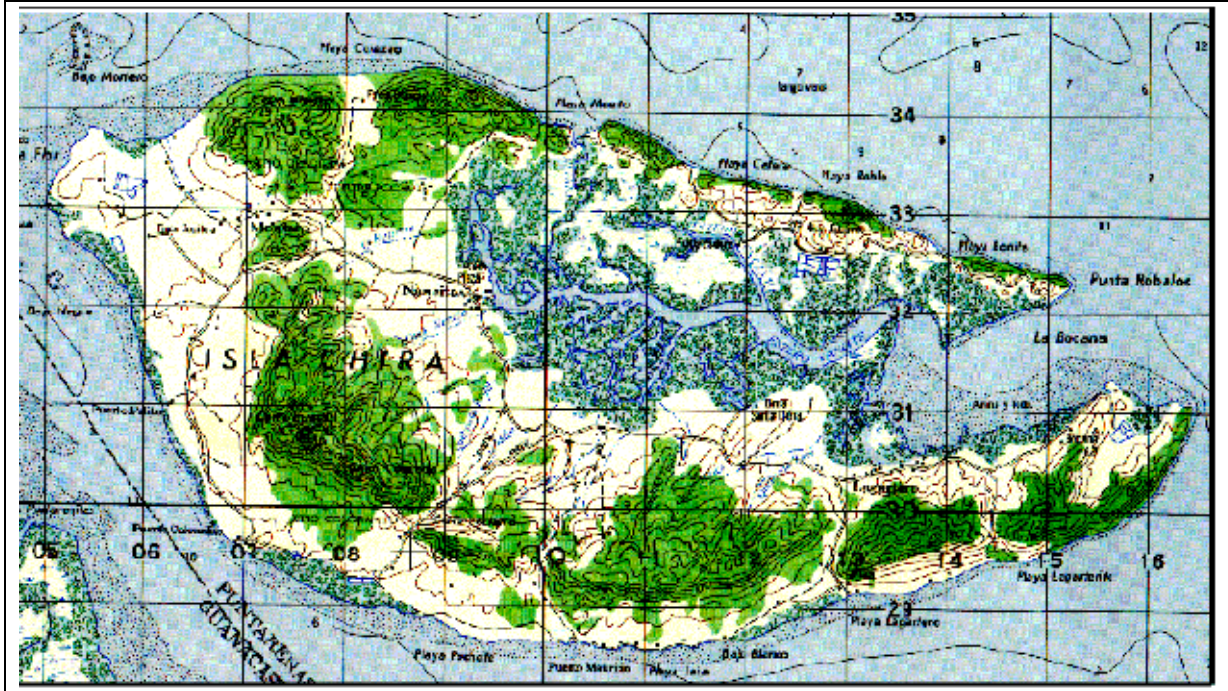
Figura 1. Distrito de Isla Chira.