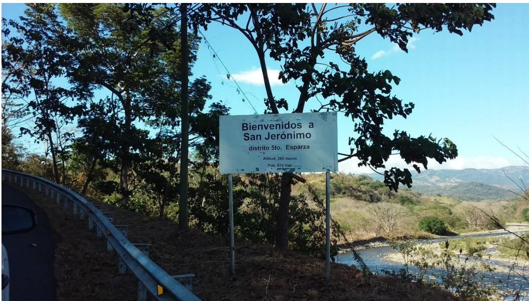
Fotografía #3. Cuenca Río Barranca

11. Fotografías representativas del área de acción de la Agencia de Extensión Agropecuaria, para ilustrar el sitio.