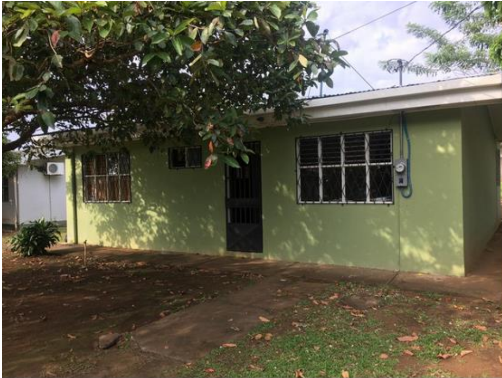
Fotografía #2. Vista Frontal de la Agencia de Esparza