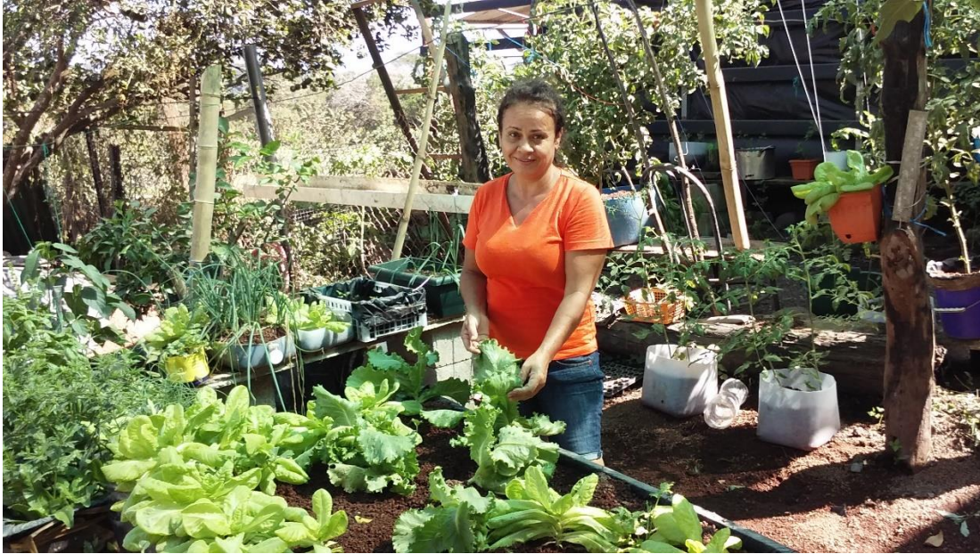
Fotografía #4. Cultivo de hortalizas para autoconsumo