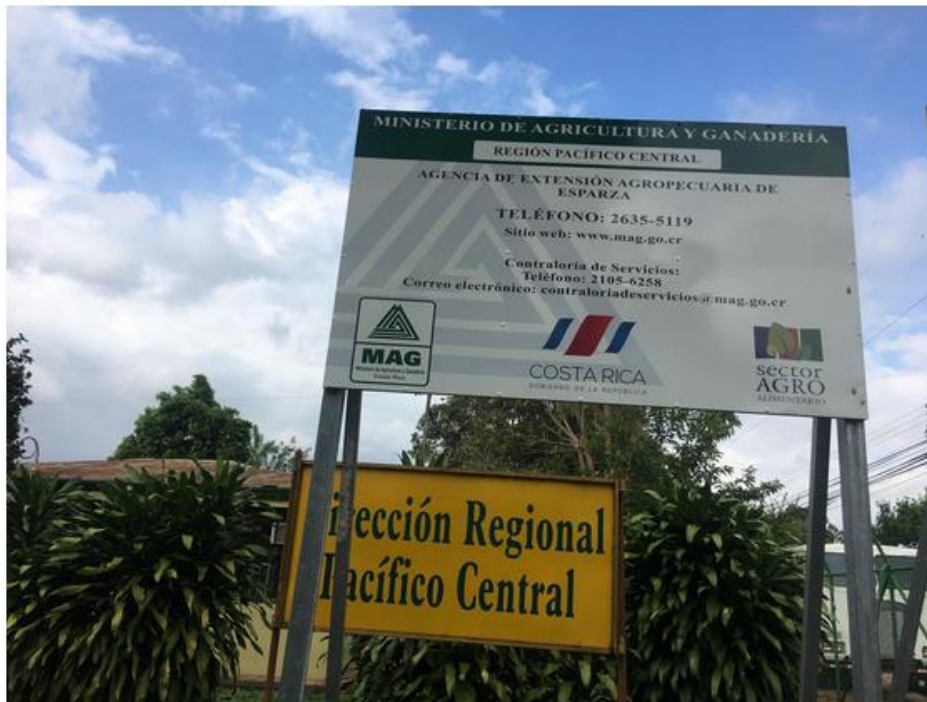
Fotografía #1. Rótulo de la Agencia de Esparza

Agencia de Extensión Agrícola de Esparza; Lat. 10.00244° y Long. -084.66108°; 21056520 y 21056521; vsalazarm@mag.go.cr