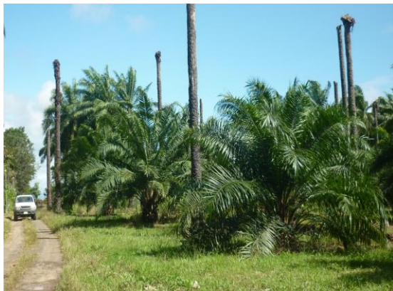
Foto 5. Renovación de Plantaciones de palma aceitera en Parrita