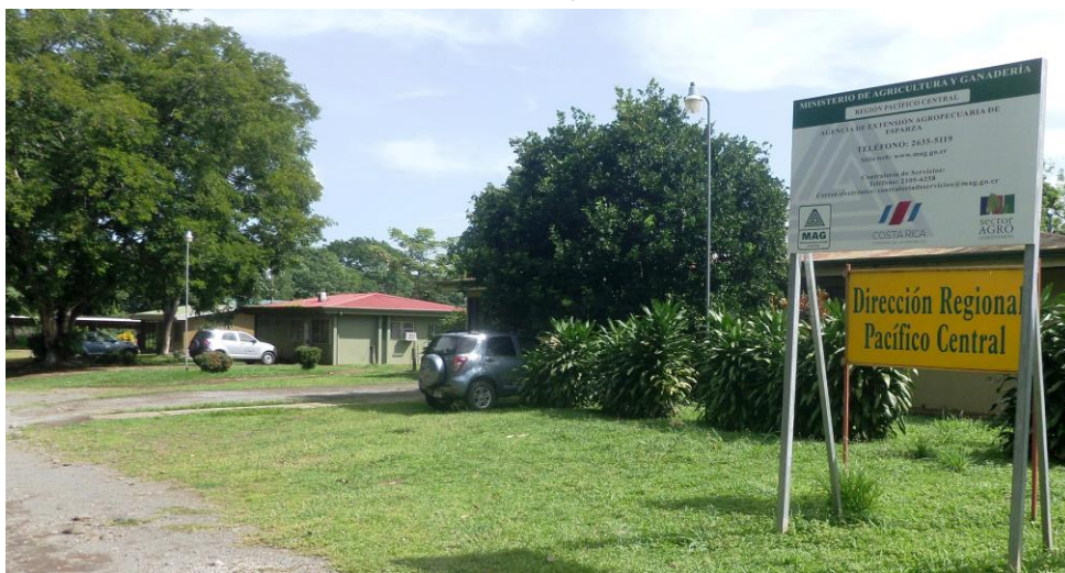
Foto 1. Dirección de Desarrollo Agropecuario del Ministerio de Agricultura y Ganadería, Esparza, Puntarenas.

Correo: La Dirección no tiene correo específico.