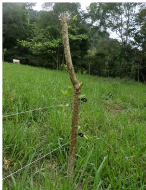
Foto 8. Establecimiento de cerca eléctrica con poste vivo en fincas ganaderas.

18. En caso que administren redes sociales, indicar: dirección electrónica, responsable de la administración de contenido, cargo, número de teléfono y dirección de correo de éste.