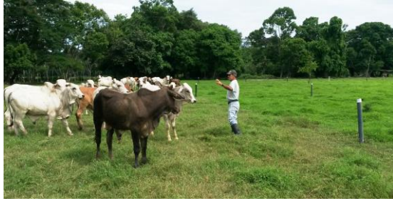
Foto 3. División de Potreros y establecimiento de cercas eléctricas en fincas ganaderas. (Douglas Rodríguez, 2017)