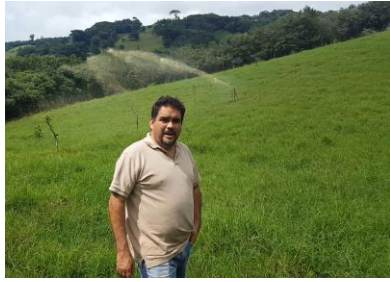
Foto 7. Proyecto de Riego de Purines con la Asociación de Productores de Leche de Monte Verde.