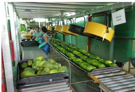
Foto 6. Selección y secado de papaya por Coopeparrita Tropical R.L.