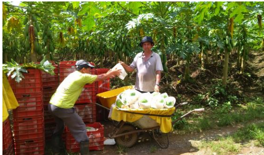
Foto 4. Producción y cosecha de papaya por pequeños productores de Parrita afiliados a Coopeparrita Tropical R.L. (Carlos Alpízar, 2017)