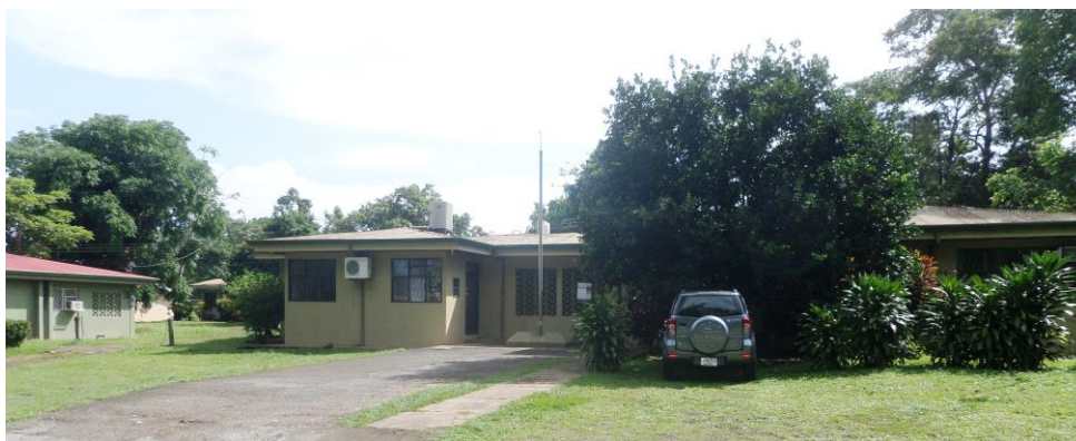
Foto 2. Dirección de Desarrollo Agropecuario del Ministerio de Agricultura y Ganadería, Esparza, Puntarenas.