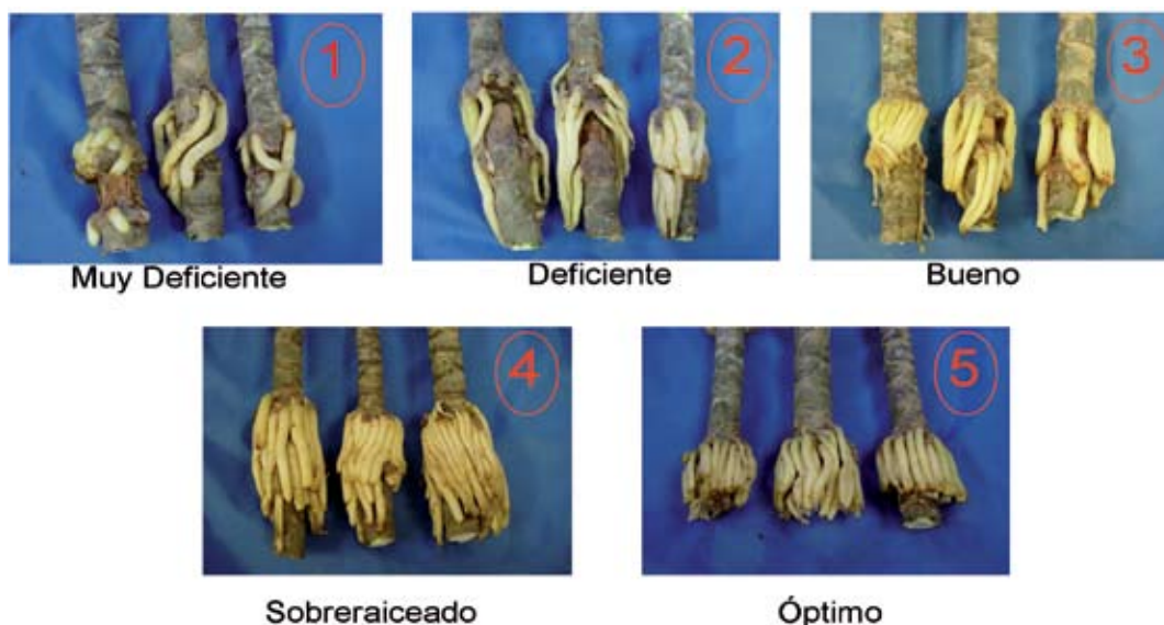
Figura 3. Clave para la evaluación de la calidad de la raíz de D. marginata . Omodeo et al. 2004.

et al. (2004, en prensa), se basa en cinco grados, a saber: muy deficiente, deficiente, bueno, sobreaiceado y óptimo.