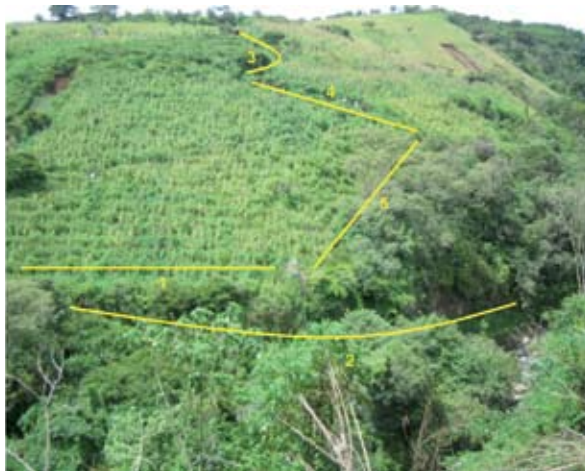
Figura 2. Ubicación de los sitios de siembra del frijol Vainica de Palo en la finca de la Cooperativa Rosales (punto 6 fuera de la imagen). Quircot, Cartago, Costa Rica. 2007.

floraciones de ambos tipos de frijol. En el 2006, se sembraron 500 plántulas del frijol Vainica de Palo el 13 de octubre y otras 500 el 27 del mismo mes.