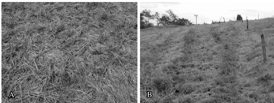
Figura 3. Efectos sobre la superficie del potrero debida a que el ganado se postra (a) o caminan por los mismos sitios formando trillos (b). Coronado, San José, Costa Rica. 2008.