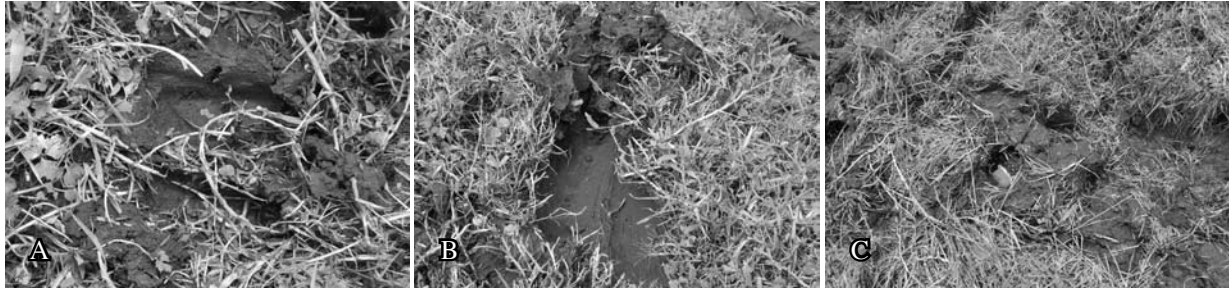
Figura 1. Efecto inmediato del pisoteo del ganado en la superficie del suelo con cobertura permanente de pasto kikuyo (a. huella de la pisada, b. deslizamiento de la pisada y c. acumulación de agua en área de pisoteo). Coronado, San José, Costa Rica. 2008.

producto del deslizamiento de la pisada; en este caso, la superficie afectada puede duplicarse y la cobertura del ecosistema reducirse en cantidades relevantes (Figura 1b). Esta presión, producto del pisoteo de los animales sobre la superficie del suelo se incrementa con el