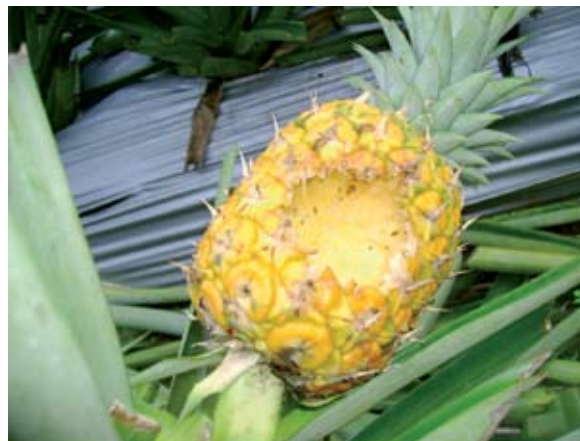
Figura 3. Fruto de piña dañado por zarigüeya o por zorro de cuatro ojos ( Didelphidae ), en Santa Cecilia, La Cruz, Guanacaste, Costa Rica. 2009.

de la fruta, cuyo diámetro variaba entre 5-8 cm, con una profundidad entre 3-5 cm (Figura 3). En algunos casos los frutos permanecían adheridos a la planta, y los daños aparecían agrupados, es decir tres a cuatro plantas aledañas presentaban el mismo tipo de daño. A pesar del daño que puede ocasionar esta especie, es importante resaltar que aún cuando no se realizó una estimación precisa, el impacto es relativamente bajo. A su vez, según lo observado en el campo, los frutos dañados, correspondían a aquellos no cosechados y dejados en el campo, dado que su madurez superaba el grado aceptable para ser utilizado como producto de exportación, y eventualmente hasta para el mercado nacional. Sin embargo, estos frutos pueden ser utilizados por el productor mismo, aún cuando el producto no fuera comercializado.