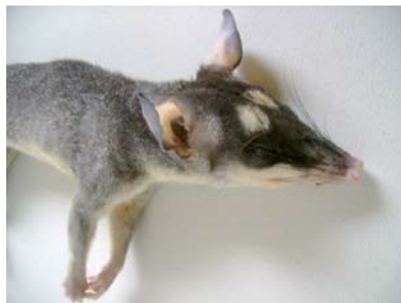
Figura 2. Zorro de cuatro ojos ( Philander opossum ), colectado en Santa Cecilia, La Cruz, Guanacaste, Costa Rica, mostrando las dos manchas blancas sobre los ojos, las que dan origen a su nombre común. 2009.

Las capturas obtuvieron como resultado un animal para los meses de marzo y junio, y de dos especies en mayo, julio y agosto (Cuadro 1). La presencia de individuos juveniles en estos meses, indica que desde mediados de época seca y la lluviosa podría existir actividad reproductiva de la especie en el sitio de estudio, según lo observado por Biggers (1966) en Nicaragua y Fleming (1973) en Panamá. La muestra de estudio indicó que hubo mayor presencia de machos, representando el 75% del total. Esto puede obedecer a una mayor representatividad de los machos sobre