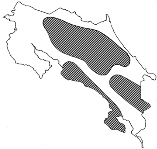
Figura 1. Mapa de distribución de las taltuzas ( Orthogeomys spp), independientemente de la especie en Costa Rica. 2009.

Según este mapa, al menos la mitad del territorio nacional cuenta con la presencia de alguna especie de taltuza, lo cual coincide con importantes áreas de producción agrícola, como lo son zona Atlántica y Norte, el Valle Central, y el Pacífico Central y Sur. Dado que por sus hábitos alimentarios, las taltuzas aprovechan con frecuencia los recursos que los agroecosistemas les ofrecen, la convierten en una especie considerada como una plaga vertebrada importante para diferentes cultivos.