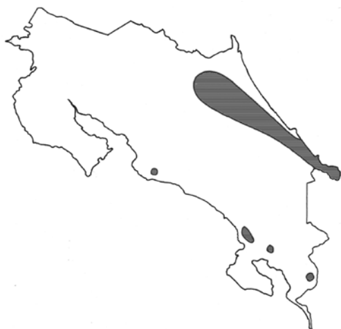
Figura 2. Zonas de producción de banano en Costa Rica. 2009.