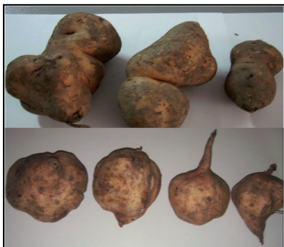
Figura 4. Diferentes defectos en las raíces reservantes de batata: Formas no típicas. Laboratorio de Procesamiento Primario de Productos Agrícolas, Facultad de Agronomía, Universidad Central de Venezuela. 2014.

Adicionalmente, se encontraron defectos en los lotes cosechados de batata (Figura 4), relacionados con la presencia de formas no predominantes o atípicas de la variedad de batata en estudio, pero en una baja proporción (2,15%). Sin embargo, se consideró que los daños y defectos, son comunes de encontrar en toda cosecha de raíces y tubérculos, representando pérdidas físicas y económicas para el productor (rechazo a nivel comercial), siendo mayores en sistemas de producción donde no se aplican las BPA (García y Pacheco, 2007b; García y Pacheco, 2008; Chacón y Reyes, 2009).