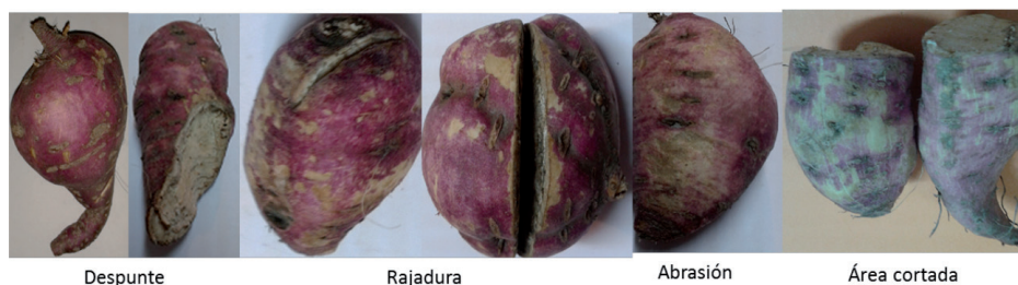
Figura 3. Tipos de daños físico-mecánico comunes en las raíces reservantes de batata. Observe las áreas sin sombreado. Laboratorio de Procesamiento Primario de Productos Agrícolas, Facultad de Agronomía, Universidad Central de Venezuela. 2014.

labor de extracción de las raíces tuberosas con la cultivadora (charruga), a excepción de las abrasiones que se atribuyó a la fricción que provoca la unidad de empaque (saco de material sintético) sobre la piel lisa y turgente de las batatas, durante el manejo. Otro daño observado en una baja relación porcentual (0,4%), fue la presencia de pudrición blanda y acuosa, causada por microorganismos, debido al exceso de humedad en una