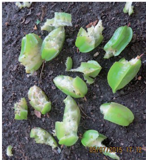
Figura 2. Frutos de A. carambola dañados por Amazona albifrons en un huerto familiar con dos árboles de carambola, en el municipio de Cárdenas, Tabasco, México, del 21 de junio al 2 de agosto de 2015.

Figure 1. Loss of star fruit fruits caused by Amazona albifrons in a home garden with two trees of star fruit, in Cardenas, Tabasco, Mexico, from June 21 st to August 2 nd , 2015.