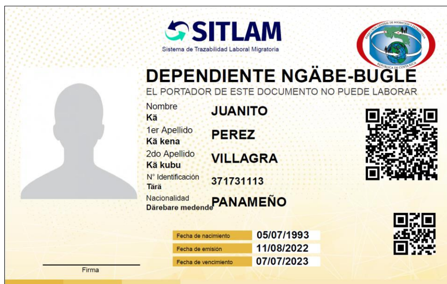
Ilustración 7.- Carné SITLAM (indígenas panameños Ngäbe Bugle -dependientes-).

* Imagen con carácter ilustrativo y los datos son ficticios.