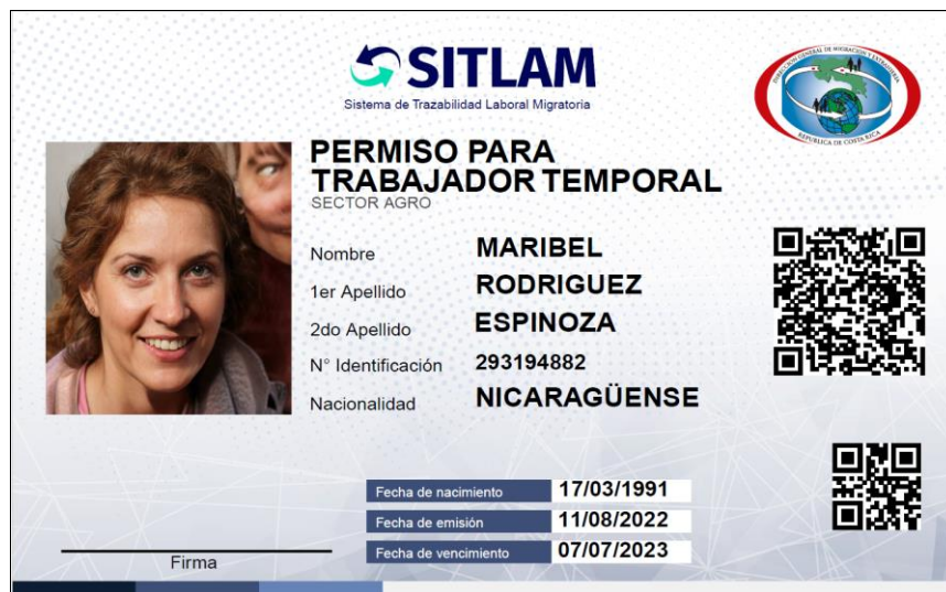
Ilustración 5.- Carné SITLAM (nicaragüenses).

* Imagen con carácter ilustrativo y los datos son ficticios.