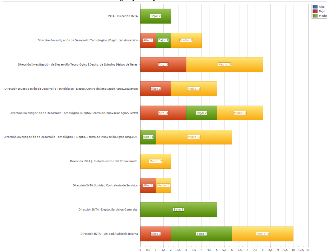
Gráfico N°1: INTA-Nivel de los riesgos por dependencia. Diciembre 2025.